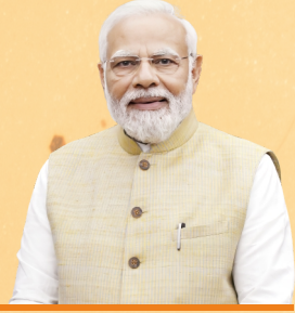
श्री नरेन्द्र मोदी माननीय प्रधानमंत्री