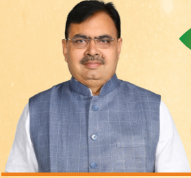
श्री भजनलाल शर्मा माननीय मुख्यमंत्री, राजस्थान